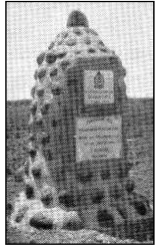
3. Monument te Willowmore