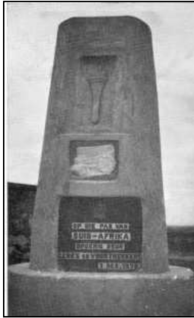
2. Monument te Kruidfontein