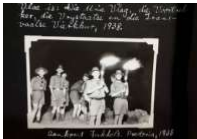
5. Aankoms van fakkels in Pretoria.