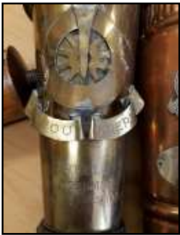
4. Fakkel by Voortrekker HK in Pretoria