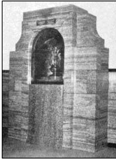
Die vlam in die nis in die Voortrekkermonument