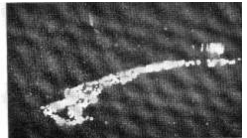
6. Fakkel-optog by aankoms